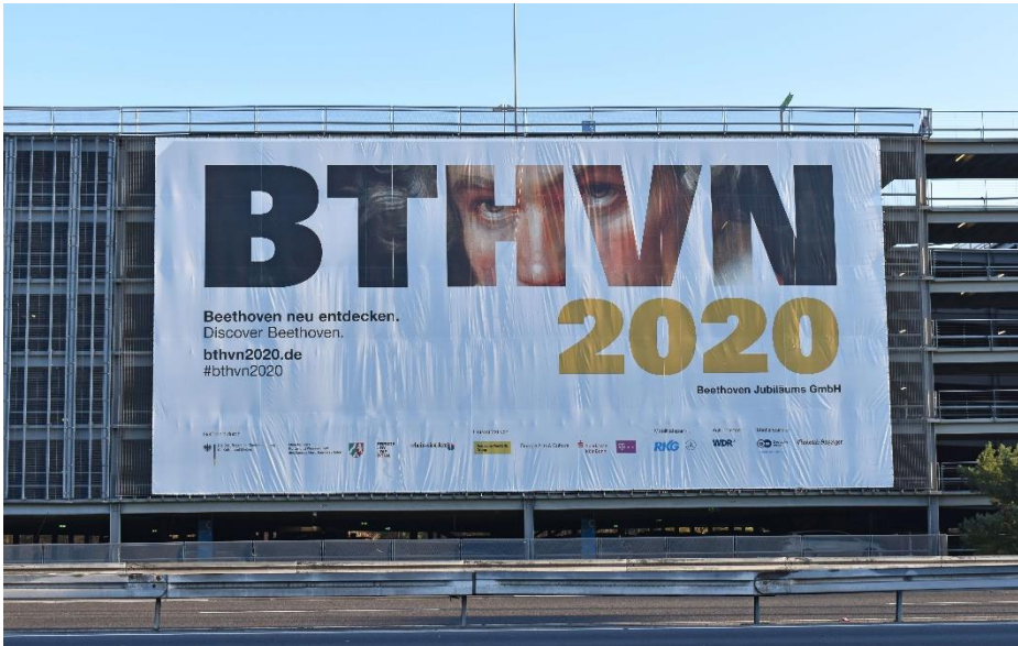
Das 32 mal 14 Meter große Plakat an Parkhaus 3 macht das Dachmarkenlogo BHTVNVN2020 weithin sichtbar und lädt dazu ein „Beethoven neu zu entdecken“